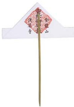
雷除(1駄500円) 7月9日・10日に限り授与